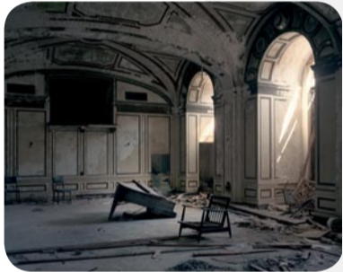
Jason Koxvold « Lee Plaza » 120 x 96 cm / ed° 15 / 260 €