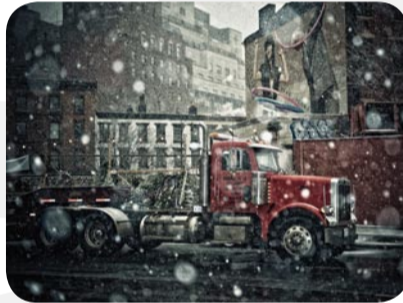
Rinze van Brug « Truck in snow » 60 x 80 cm / ed° 15 / 200 €