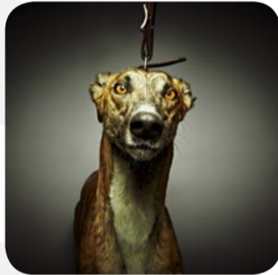
Toby Dixon « Boss » 45 x 45 cm / ed° 30 / 170 €